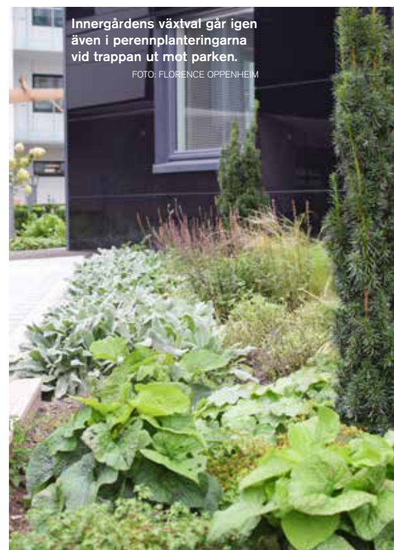
Innergårdens växtval går igen även i perennplanteringarna vid trappan ut mot parken.

– Lammöra är så fin och lyser upp under den mörka årstiden på vintern och våren. ▶