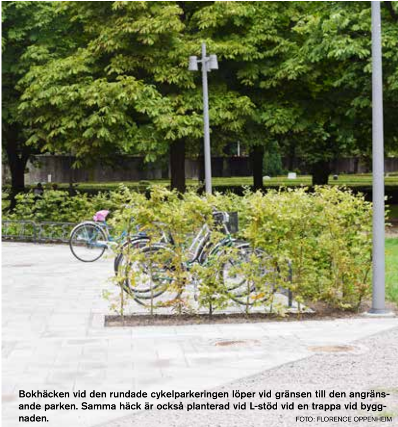
Bokhäcken vid den rundade cykelparkeringen löper vid gränsen till den angränsande parken. Samma häck är också planterad vid L-stöd vid en trappa vid byggnaden.