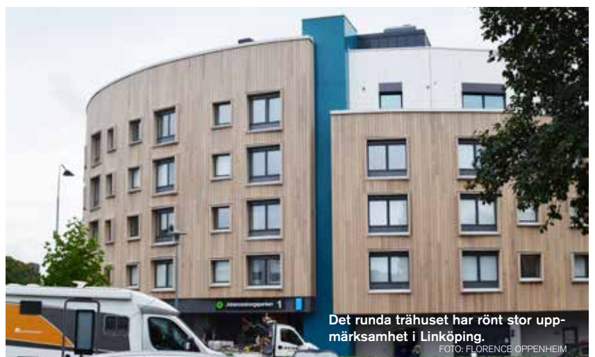
Det runda trähuset har rönt stor uppmärksamhet i Linköping.