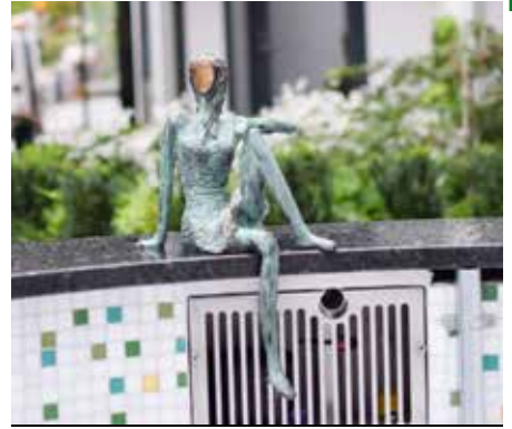
En öppen vattenyta var ett önskemål från fastighetsägaren. Här smyckad med en statyett.

– Vår ambition var att skapa en trivsamt och grön innergård där våra boende känner sig välkomna att slå sig ned med en kopp kaffe eller bara njuta av solen i söderläget. Vi ville att gården genom den inbjudande trappan fick ett fint samband med parken. Eftersom vårt hus ligger granne med kyrkogården var det också viktigt att livet från huset koncentrerades inåt på gården och ut mot parken.