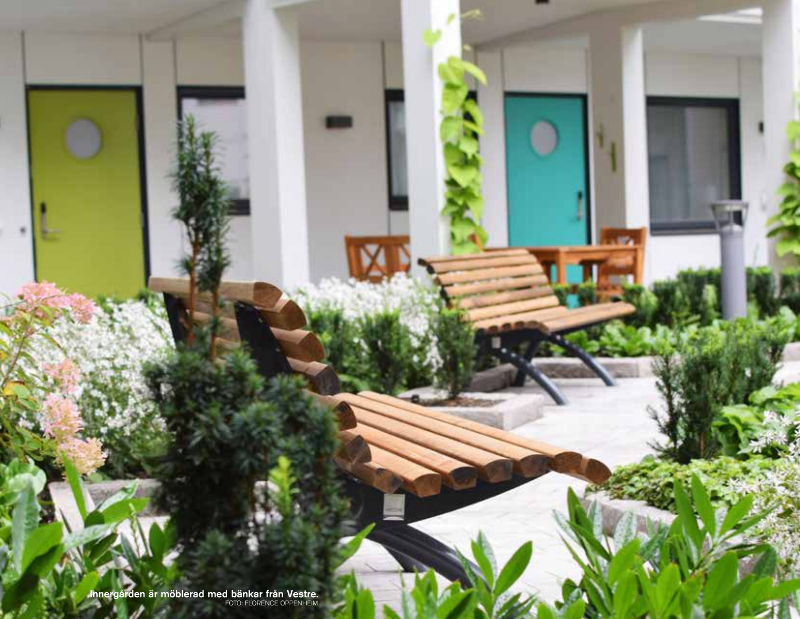
Innergården är möblerad med bänkar från Vestre.